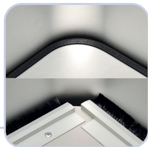
Engeres Spaltmaß mit Auflageplatte oder Bürstenleiste