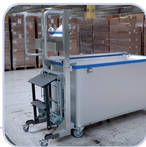
Leiter, Schiebehilfe, Getränke-, Scannerhalter, Etikettenabroller, Schreibtabelle oder Klemmbrett